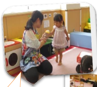
手作り靴下パペットで こんにちは (授業で参加)