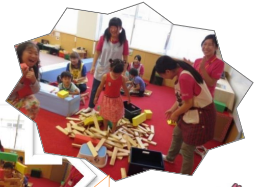
託児ボランティア (親と子どもの発達センター セミナー参加)